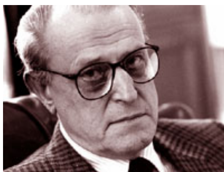
W. F. Hermans

Elnederlandigo de 'De elektriseermachine van Wimshurst'. Rakonto unuafoje aperinta en la rakontaro 'Een wonderkind of een total loss' (Mirinfano aŭ kompleta perdo) en la jaro 1967.