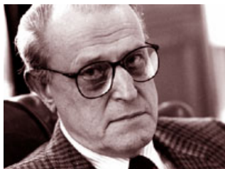
W. F. Hermans

Elnederlandigo de 'De elektriseermachine van Wimshurst'. Rakonto unuafoje aperinta en la rakontaro 'Een wonderkind of een total loss' (Mirinfano aŭ komplementa perdo) en la jaro 1967.